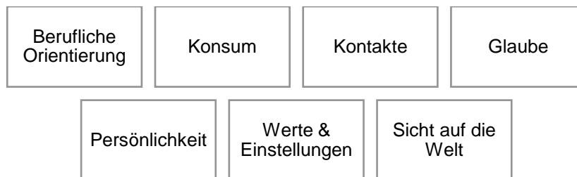
Abbildung 4 Moderationskarten Interviews

Während des Gespräches wurden den Interviewpartner*innen Moderationskarten mit den verschiedenen Themenbereichen, in denen sie Veränderungen auf den Freiwilligendienst zurückführen könnten, vorgelegt (Abbildung 4). Es gab zwei bis drei leere Karten, die zur Ergänzung der Themen gedacht war. Die Moderationskarten sollten der Übersicht und Strukturierung der Interviewten dienen.